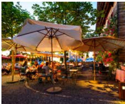
Garten Terrasse Zwischen Bar und Restaurant Max. 80 Personen: Restaurant-Seite Max. 50 Personen: Bar-Seite, zum Teil kleine runde Tische