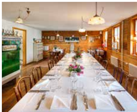
Buurestube Restaurant Erdgeschoss Max. 44 Personen: Reihen Max. 24 Personen: Blocktisch Exklusiv buchbar ab 30 Personen