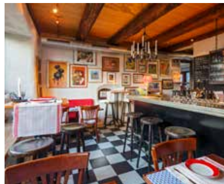
Bar Kleineres Gebäude Max. 20 Personen: Sitzend, hohe & tiefe Tische Max. 30 Personen: Stehtische