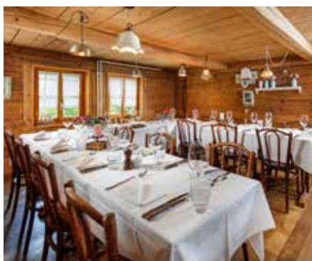
Brasserie 1. Stock, 1. Raum links, Raumhöhe: 215 cm Verbindungstür zum Salon Bleu Max. 20 Personen: Reihen Max. 14 Personen: Blocktisch Max. 18 Personen: U-Form Exklusiv buchbar ab 16 Personen