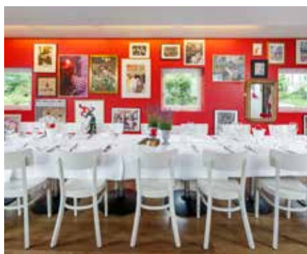
Salon Rouge 1. Stock, Rechte Seite, Anbau Max. 44 Personen: Reihen Max. 28 Personen: Blocktisch Exklusiv buchbar ab 30 Personen