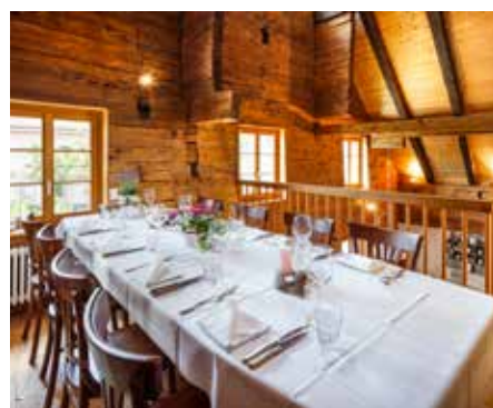
Galerie oben 2. Stock, linke Seite Max. 10 Personen