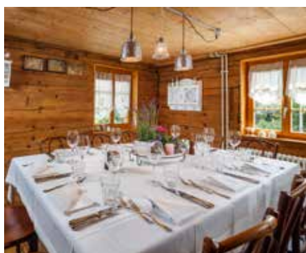
Werder Stübli 1. Stock, 3. Raum hinten, Raumhöhe: 215 cm Verbindungstür zum Salon Bleu Max. 12 Personen: Reihen Max. 10 Personen: Blocktisch Exklusiv buchbar ab 8 Personen