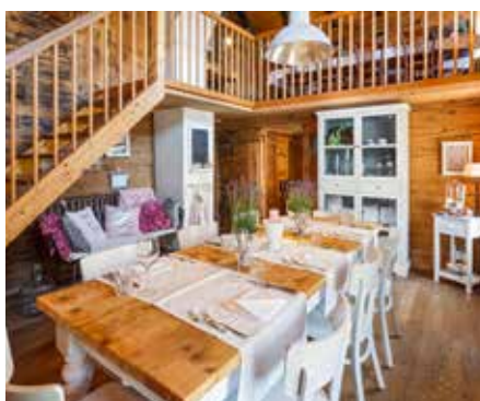
Galerie unten 1. Stock, linke Seite Max. 8 Personen