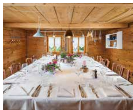
Salon Bleu 1. Stock, 2. Raum links, Raumhöhe: 215 cm Verbindungstür zur Brasserie & Werder Stübli Max. 20 Personen: Reihen Max. 14 Personen: Blocktisch Max. 18 Personen: U-Form Exklusiv buchbar ab 16 Personen