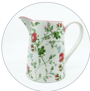
Greengate Krüge 1,5 Liter

Schlendern Sie herum, entdecken Sie die verschiedenen Möbel, Regale, Accessoires, Karten und Gadgets die im ganzen Restaurant sowie im Shop ausgestellt sind.